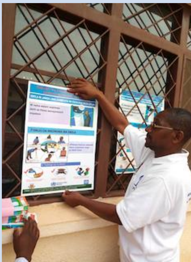
Affiches posées dans un centre de santé