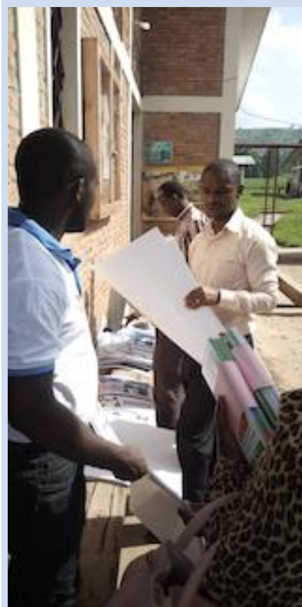
Remise des outils de communication à un DS