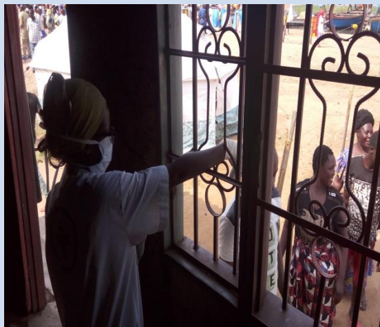
Screening des passagers au point d'entrée de Rumongé