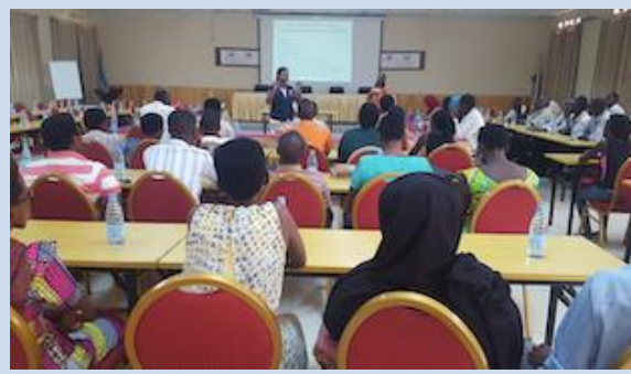
Formation des agents de santé communautaires à Bujumbura Centre