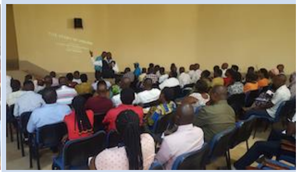
Formation des titulaires des CDS et TPS de Bujumbura Centre et Nord sur le système alerte précoce choléra