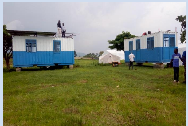
Installation de contenaires au point d'entrée de Nyamugari