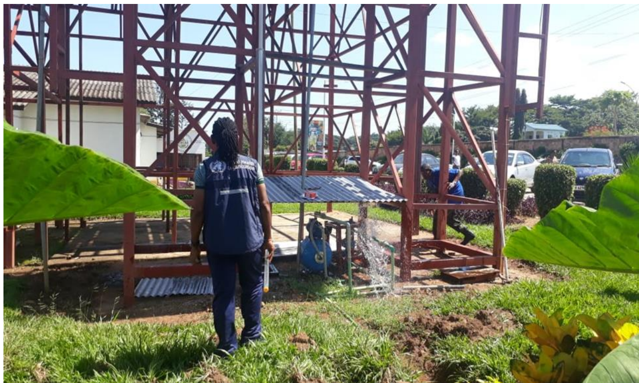
Analyse de la qualité de l'eau à l'hôpital militaire de Kamenge

Mise à jour hebdomadaire de la préparation à faire face à la Maladie à Virus Ebola (MVE)