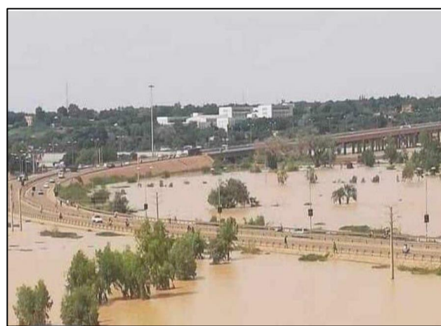
Vue de la montée des eaux au 2 ème pont situé sur le fleuve Niger à Niamey