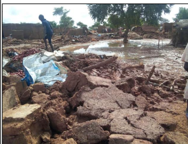
Effondrement des maisons d'habitation dans la région de Tahoua