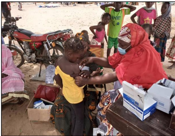
Poste de santé avancé sur le site des sinistrés au sein du Collège d'enseignement général de Lamorde 1

Les besoins sanitaires restent les mêmes de la dernière semaine. Il s'agit notamment de l'offre des soins de santé de base (un local dédié pour le poste de santé, médicaments en quantité suffisante, l'amélioration des conditions hygiéniques sur le site, la mise en place des mesures barrières à la COVID-19, l'approvisionnement en eau potable, et la mise en place du système d'alerte précoce).