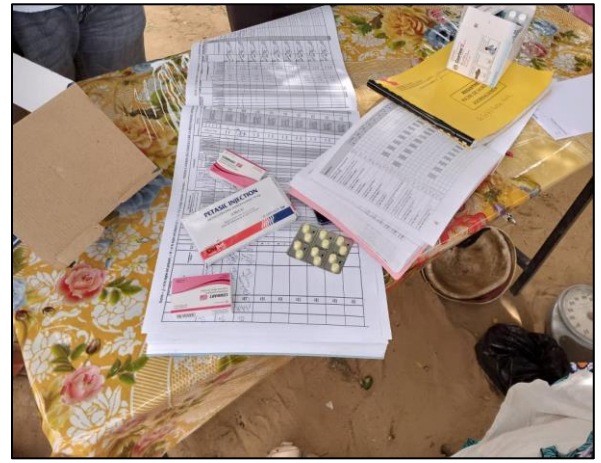
Les outils de récolte des données au niveau du poste de santé avancé du site des sinistrés de Lamordé, arrondissement communal de Niamey 5

Il convient de noter que les réunions de coordination ont relevé les défis suivants :