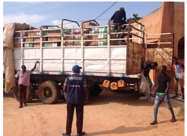
Réception des médicaments, donation de l'OMS pour la gestion des sinistrés des inondations, dans la région de Maradi