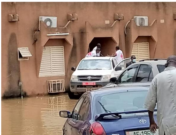
Evacuation du bureau de district sanitaire inondé de Niamey 4 par la Croix Rouge Nigérienne