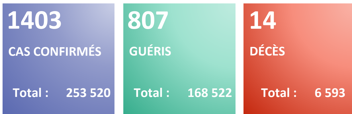
Figure 1 : Evolution du nombre quotidien de nouveaux cas confirmés et nouveaux décès par COVID-19 du 25 février 2020 au 01 février 2022 en Algérie

Rapport N° 673 Date du rapport : 2 février 2022 Date des Données : 1 février 2022