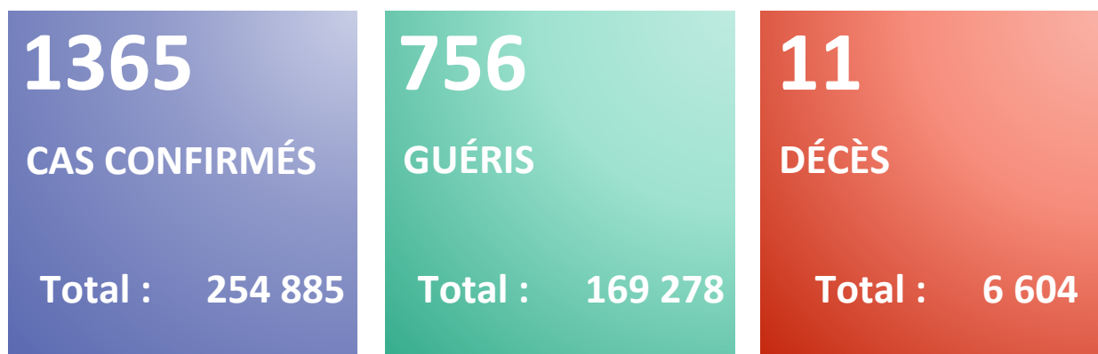
Figure 1 : Evolution du nombre quotidien de nouveaux cas confirmés et nouveaux décès par COVID-19 du 25 février 2020 au 02 février 2022 en Algérie

Rapport N° 674 Date du rapport : 3 février 2022 Date des Données : 2 février 2022