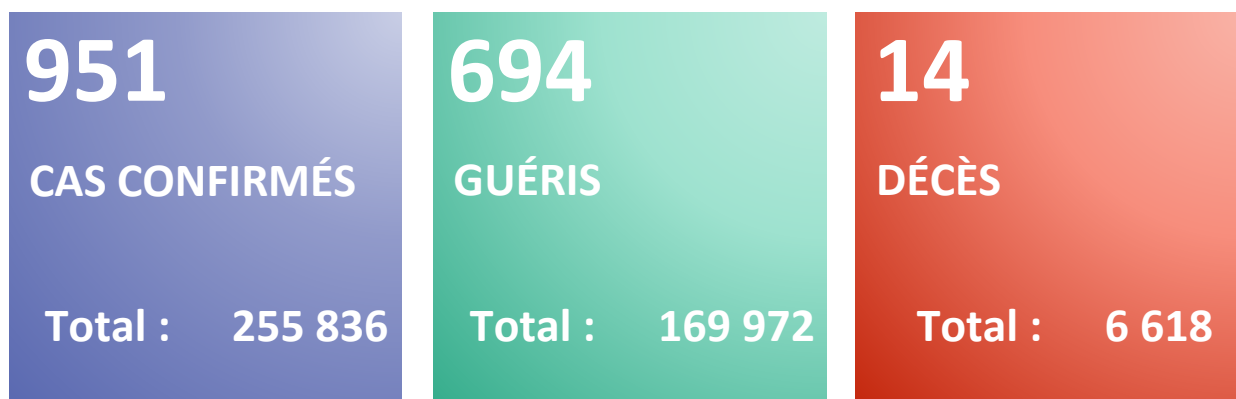
Figure 1 : Evolution du nombre quotidien de nouveaux cas confirmés et nouveaux décès par COVID-19 du 25 février 2020 au 03 février 2022 en Algérie

Rapport N° 675 Date du rapport : 4 février 2022 Date des Données : 3 février 2022