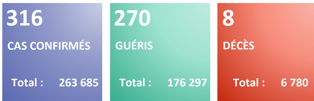
Figure 1 : Evolution du nombre quotidien de nouveaux cas confirmés et nouveaux décès par COVID-19 du 25 février 2020 au 18 février 2022 en Algérie

Rapport N° 688 Date du rapport : 19 février 2022 Date des Données : 18 février 2022