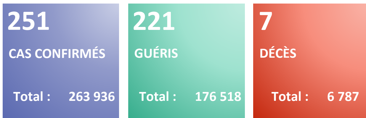
Figure 1 : Evolution du nombre quotidien de nouveaux cas confirmés et nouveaux décès par COVID-19 du 25 février 2020 au 19 février 2022 en Algérie

Rapport N° 689 Date du rapport : 20 février 2022 Date des Données : 19 février 2022