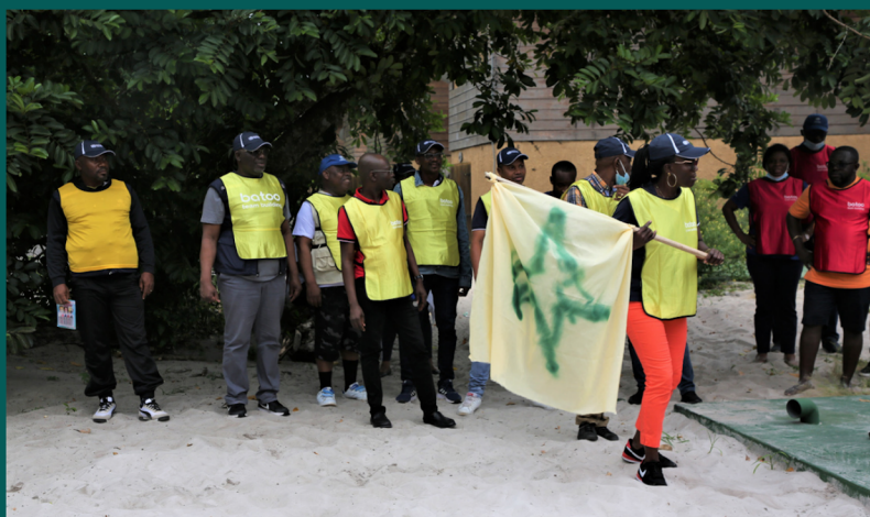
L'AIGLE « MBIRE »