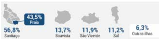
Figura 2: Distribuição da população imigrante, por ilhas. Cabo Verde, 2018

A Praia é o maior município do país, em termos de número de habitantes e de população urbanizada. Igualmente, é o mais cosmopolita dos municípios, albergando população de todas as ilhas e imigrantes provenientes de vários países, inclusive de países de endemia palustre, com destaque para a Guiné-Bissau. Existem vários bairros populosos no concelho, alguns com sinais de degradação marcantes, em termos sociais, económicos e sanitários. Ocorre, ainda, na Praia um forte movimento pendular com o interior da ilha, resultando na mobilidade diária de milhares de pessoas, para a cidade da Praia.