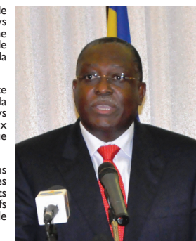
Son Excellence le Vice-Président de la République d'Angola Eng. Manuel Domingos Vicente

Je tiens à réitérer la profonde gratitude de tous les Angolais pour l'appui sans faille que nos partenaires de développement nous ont accordé sur les plans technique et financier, notamment l'OMS et d'autres institutions des Nations Unies.