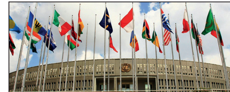
Centre de Conférence des Nations Unies, Addis Abeba, Éthiopie, lieu de la 66 ème Session du Comité régional